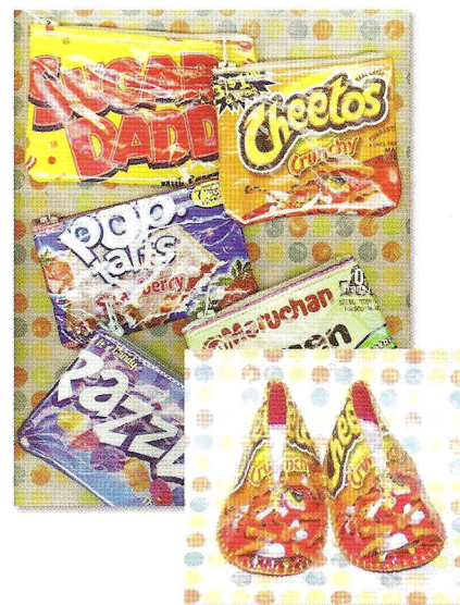
Producten van MoJoTrashion, vervaardigd van verpakkingsmaterialen.

MoJoTrashion is geen project van een kunstenaar maar een Amerikaans webwinkeltje dat producten verkoopt van verpakkingen. Tasjes, etuis, portemonnees, visitekaart-