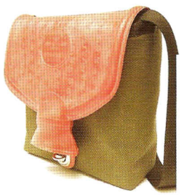
Handgemaakte tassen van Abteil. Let op die met de oranje klep, gemaakt van een kruikenzak.