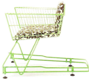
Stoel Annie, ontstaan uit een winkelwagentje.

De stoelen en andere meubelstukken van Reestore zijn een stuk aangenamer om naar te kijken. Deze Engelsen kruisen gebruiksvoorwerpen die niets met elkaar te maken hebben en het resultaat is heel bijzonder. Net als bij winkels als IKEA hebben de Reestoremeubels allemaal een